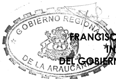
FRANCISCO HUENCHUMILLA JARAMILLO INTENDENTE Y EJECUTIVO DEL GOBIERNO REGIONAL DE LA ARAUCANIA