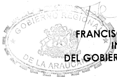
FRANCISCO HUENCHUMILLA JARAMILLO INTENDENTE Y EJECUTIVO DEL GOBIERNO REGIONAL DE LA ARAUCANIA