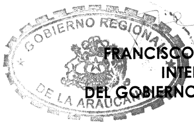
FRANCISCO HUENCHUMILLA JARAMILLO INTENDENTE Y EJECUTIVO DEL GOBIERNO REGIONAL DE LA ARAUCANIA