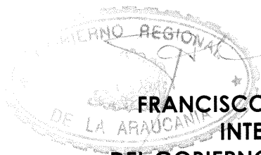
FRANCISCO HUENCHUMILLA JARAMILLO INTENDENTE Y EJECUTIVO DEL GOBIERNO REGIONAL DE LA ARAUCANIA