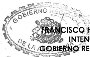
FRANCISCO HUENCHUMILLA JARAMILLO INTENDENTE Y EJECUTIVO GOBIERNO REGIONAL DE LA ARAUCANIA