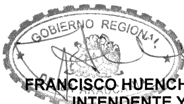
FRANCISCO HUENCHUMILLA JARAMILLO INTENDENTE Y EJECUTIVO GOBIERNO REGIONAL DE LA ARAUCANÍA